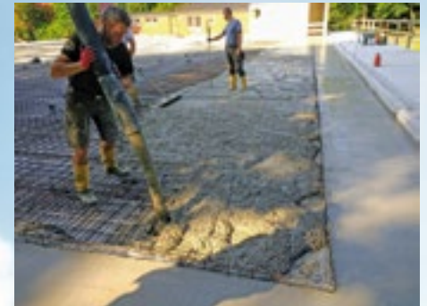
Das Fundament wird geschüttet

Der Start des Baubeginns begann in einer Bauhochphase und die Auflagen durch die Pandemie führten zu Preissteigerungen, die bei den Planungen so nicht vorgesehen waren.