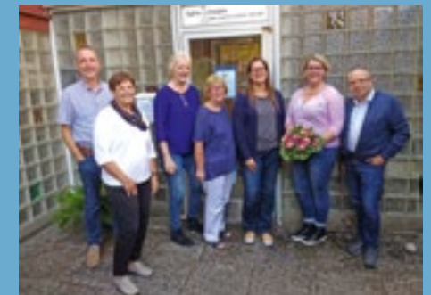
Vorstand mit Geschäftsführerin und Koordinatorin