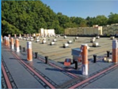
Vorbereitung für die Dachisolierung/dämmung