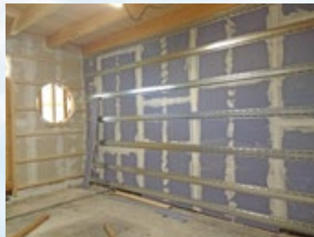
Vorbereitung für die Endmontage