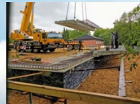
Die Grundmauer steht, Terrassenteile werden montiert