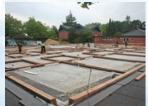
Vorbereitung für die Wandmontage