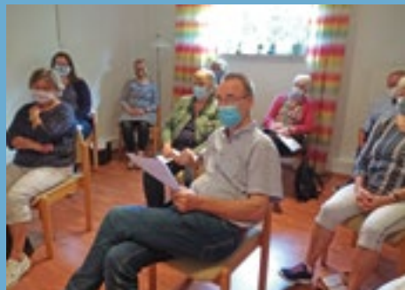
MV im Zeichen von Corona