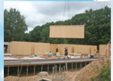
Die ersten Wände stehen