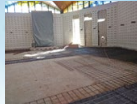
Auch im Heptagon tut sich was