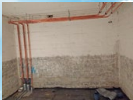
Die ersten Leitungen sind montiert

Spenden Sie bitte auf dieses Hospiz-Sonderkonto: DE31 2512 0510 6600 0021 00