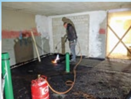
Isolierung der Böden gegen aufsteigende Feuchtigkeit