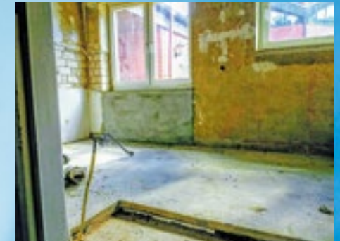
Das wird mal Küche und WC