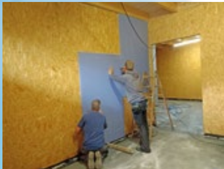
Montage der Rigipsplatten